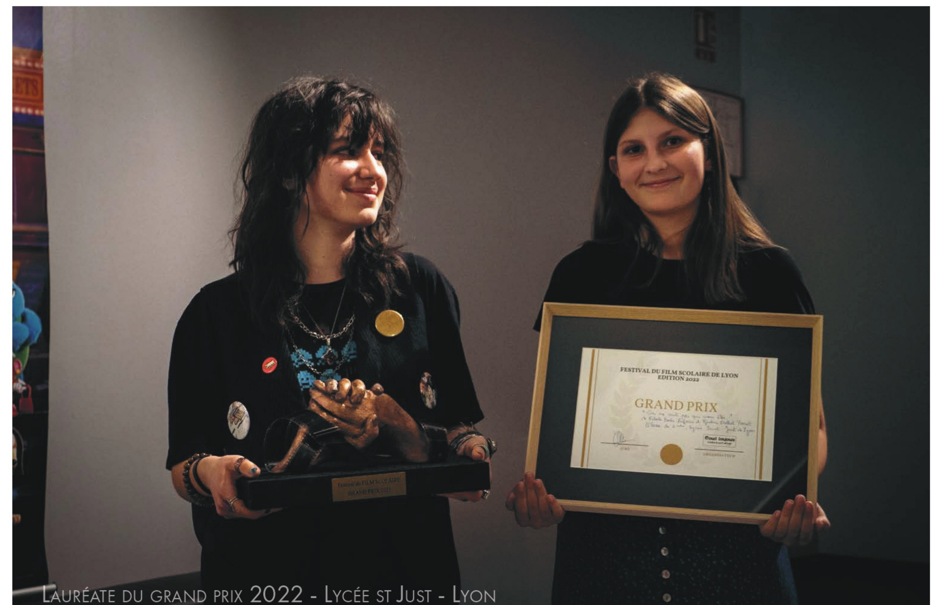
LAURÉATE DU GRAND PRIX 2022 - LYCÉE ST JUST - LYON