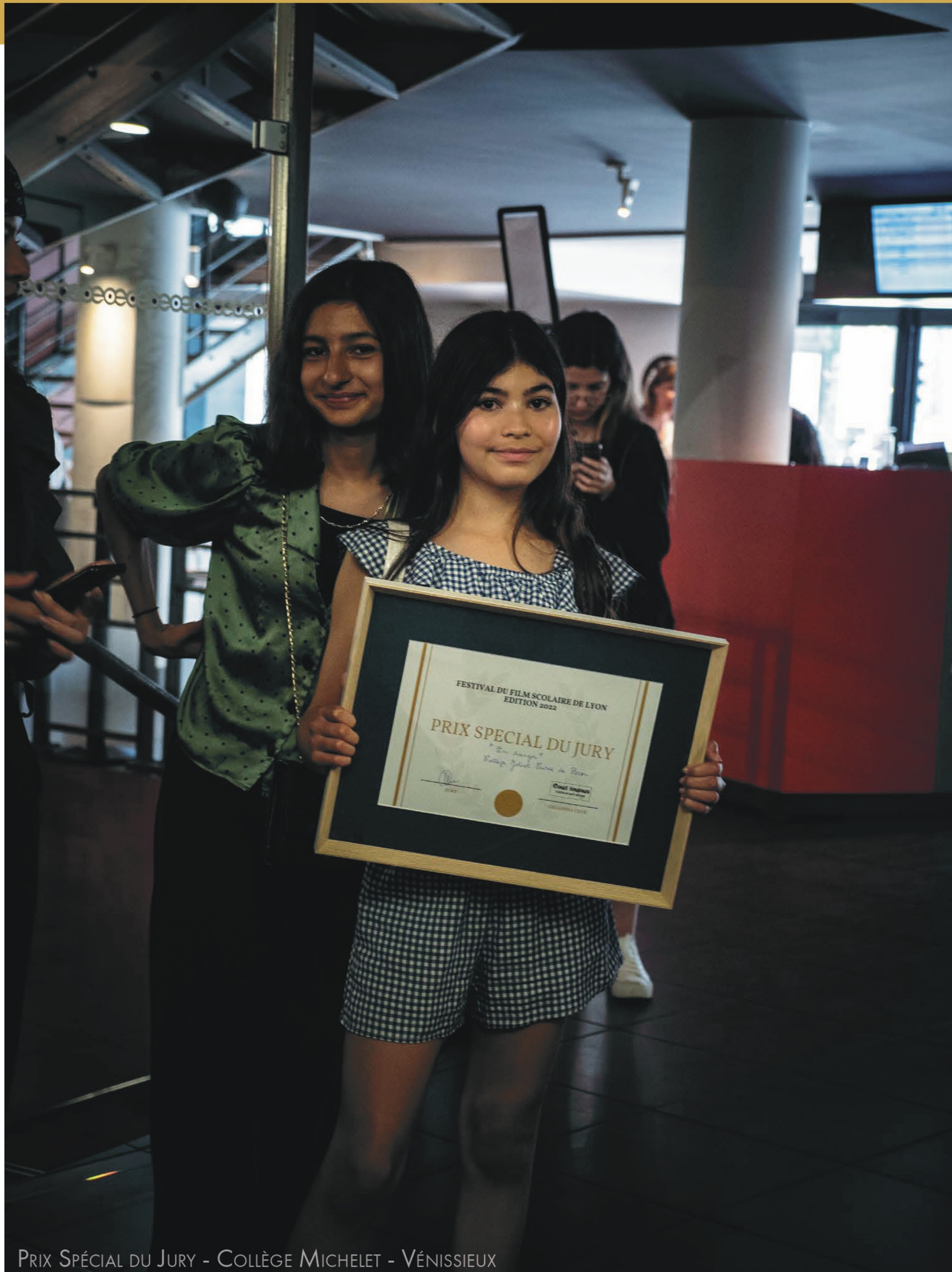
PRIX SPÉCIAL DU JURY - COLLÈGE MICHELET - VÉNISSIEUX