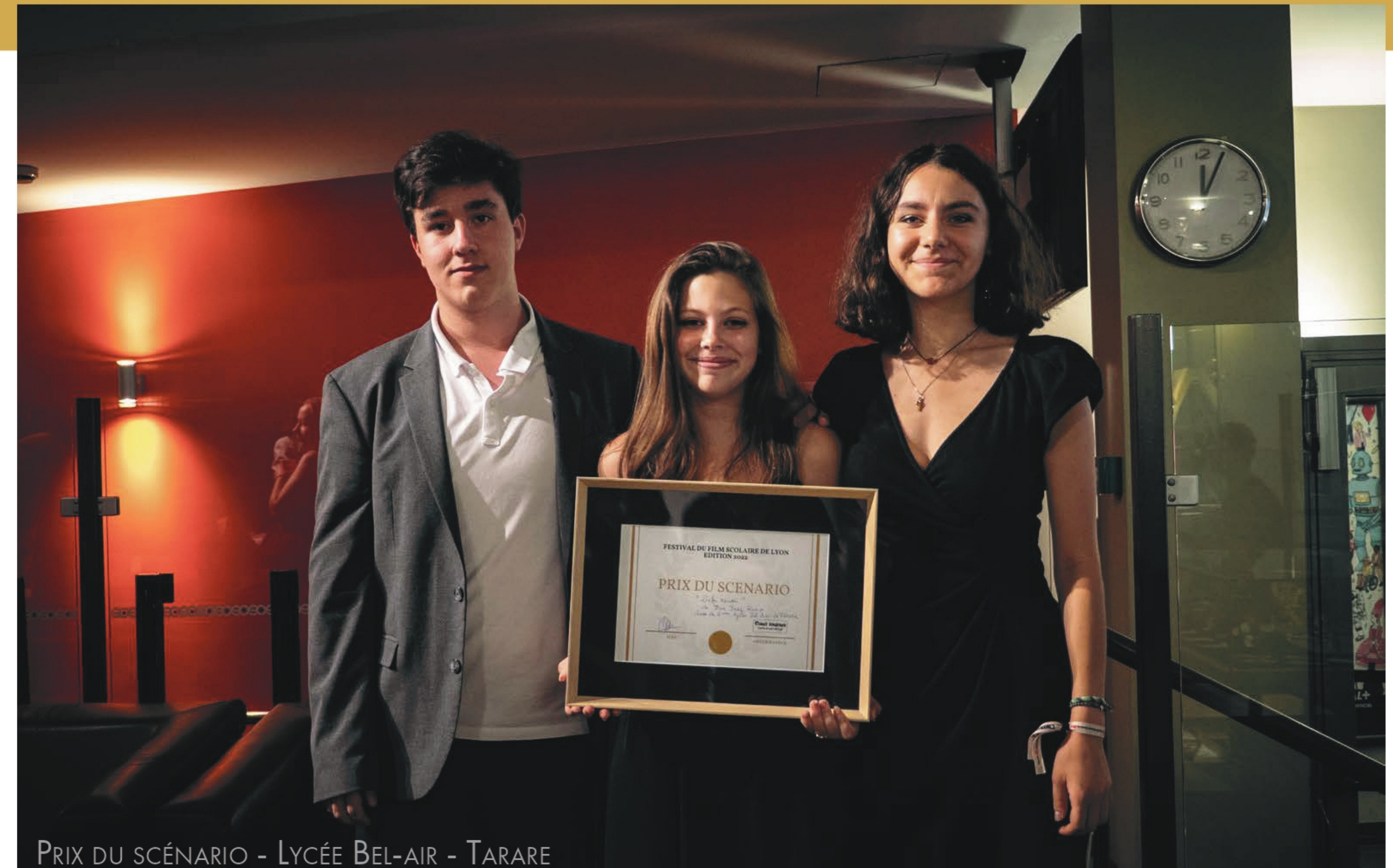
PRIX DU SCÉNARIO - LYCÉE BEL-AIR - TARARE

Les différents lauréats de cette édition 2023 verront leur film diffusé sur les chaînes du groupe France 3 Auvergne Rhône-Alpes , à un rythme de 2 court-métrages par jour sur une durée de 8 jours.