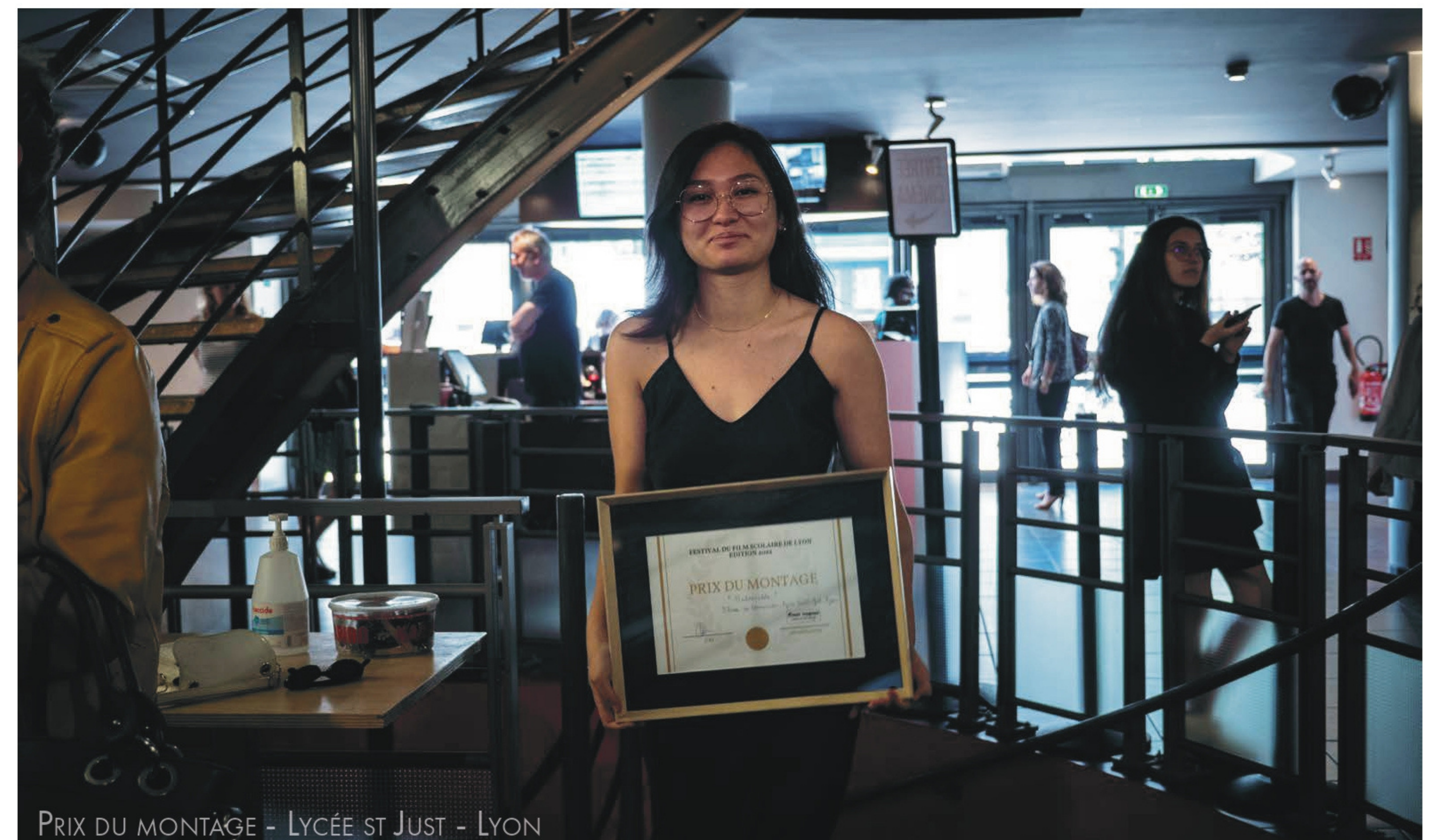
PRIX DU MONTAGE - LYCÉE ST JUST - LYON