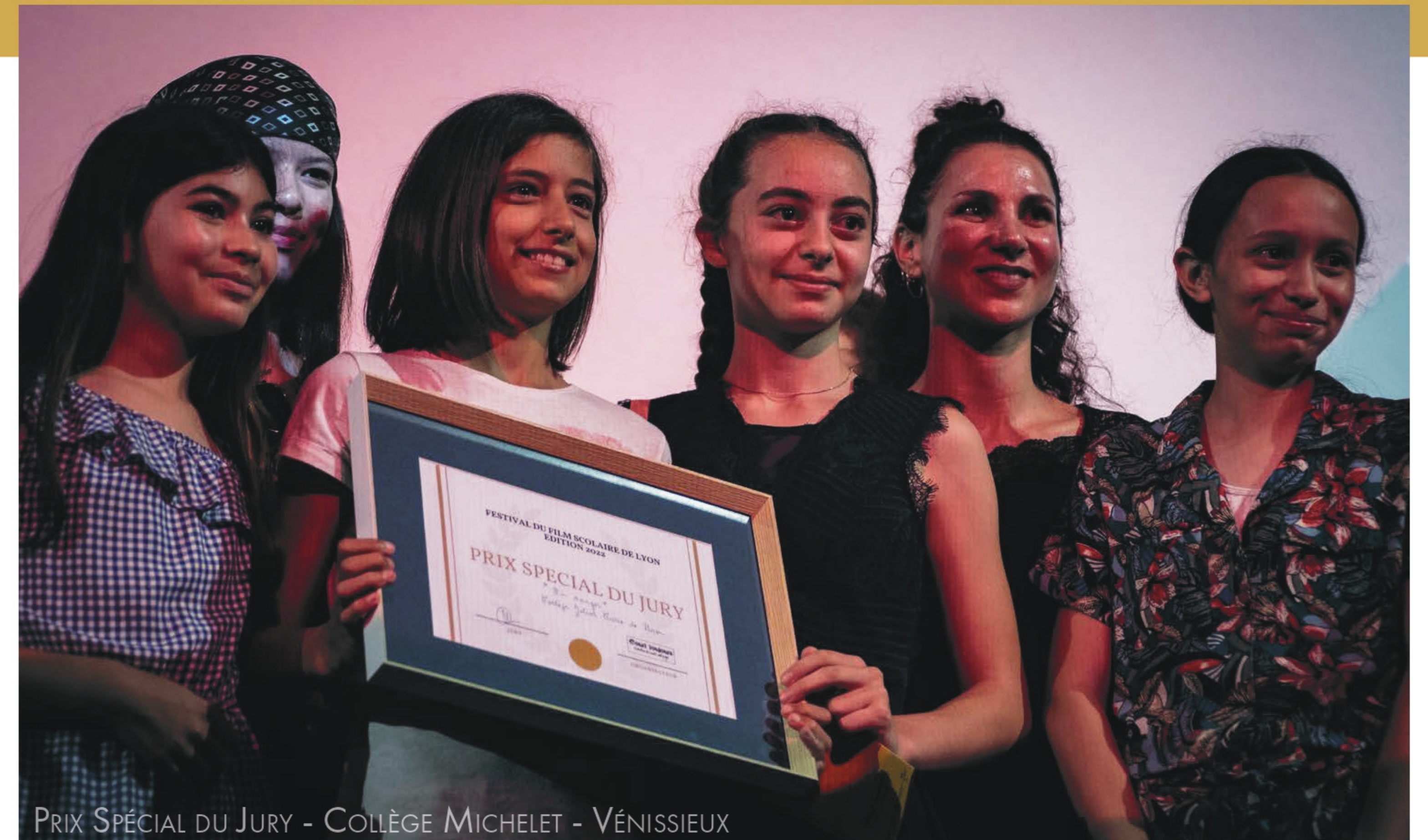
PRIX SPÉCIAL DU JURY - COLLÈGE MICHELET - VÉNISSIEUX

Le thème du festival doit développer auprès des jeunes une sensibilité et une conscience vis-à-vis de sujets forts, en leur proposant de prendre position dans leurs réalisations. Le thème de 2022 était «Engagement».